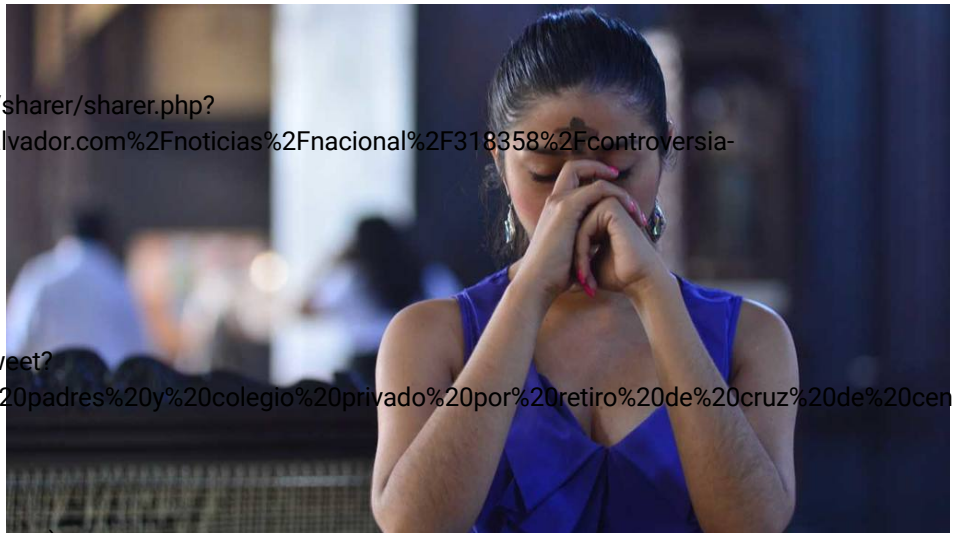
01/03/2017 Miércoles de Ceniza. Cobertura de homilía en Basílica Sagrada Ordenación Iglesia (La Transfiguración.